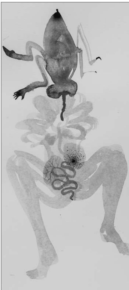
Artiste: Caroline Boileau